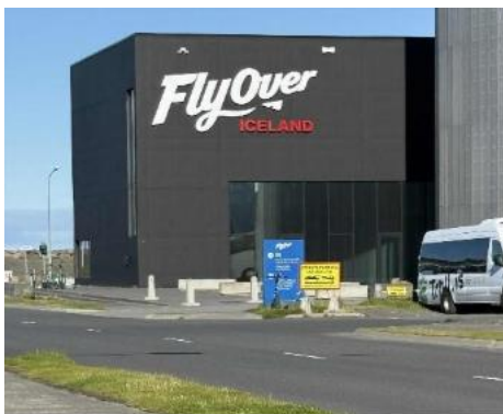
en super fin "flyvetur" 🇮🇸