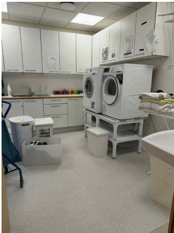
vaskerummet til de 11 beboer der bor på den ene gang jeg var på