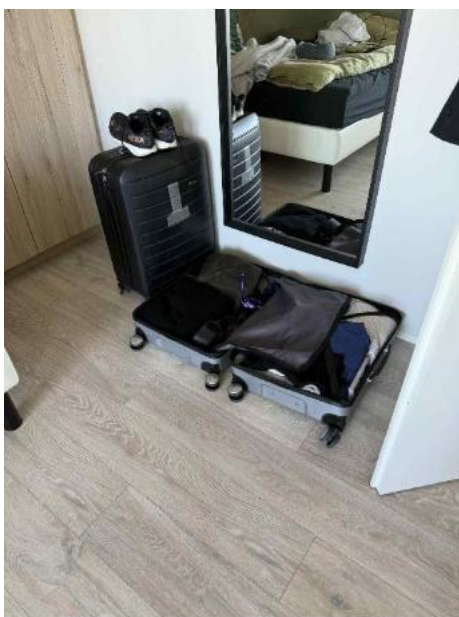
Klar til afrejse 😊