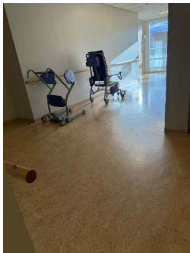
Her står de fælles hjælpemidler som alle beboerne bruger