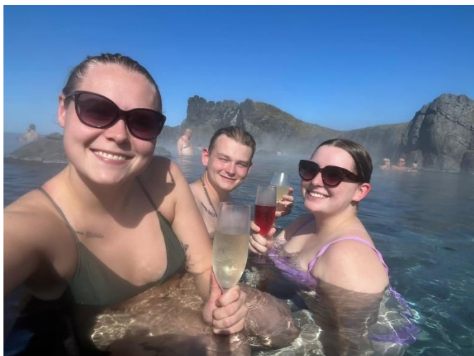
Et LILLE udklip af de mange billeder fra turen: