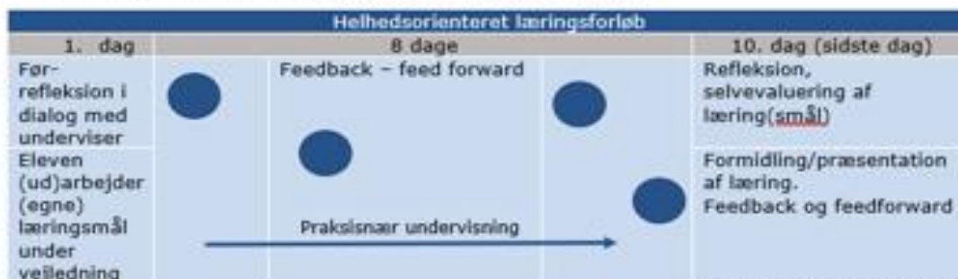
Eksempel på læringstid i et 10 dages helhedsorienteret læringsforløb

Nedenfor ses et eksempel på, hvordan en uge eller flere uges helhedsorienterede læringsforløb rammes ind af en før-refleksion/feed-up, samt efter-refleksion og feedback, og senere feedforward. Alle elementer, der er centrale for din læring.