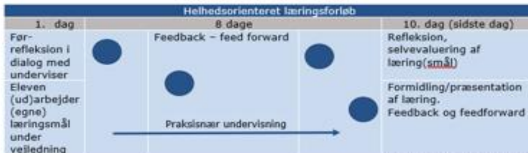
Eksempel på læringstid i et 10 dages helhedsorienteret læringsforløb

Nedenfor ses et eksempel på, hvordan en uge eller flere uges helhedsorienterede læringsforløb rammes ind af en før-refleksion/feed-up, samt efter-refleksion og feedback, og senere feedforward. Alle elementer, der er centrale for din læring.