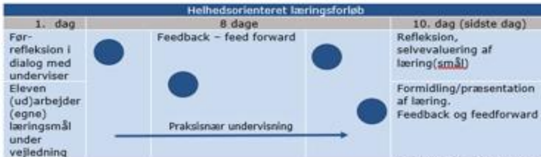
Eksempel på læringstid i et 10 dages helhedsorienteret læringsforløb

Nedenfor ses et eksempel på, hvordan en uge eller flere uges helhedsorienterede læringsforløb rammes ind af en før-refleksion/feed-up, samt efter-refleksion og feedback, og senere feedforward. Alle elementer, der er centrale for din læring.